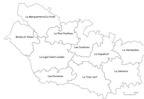
2021 par unité de gestion