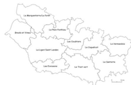
2023 par unité de gestion